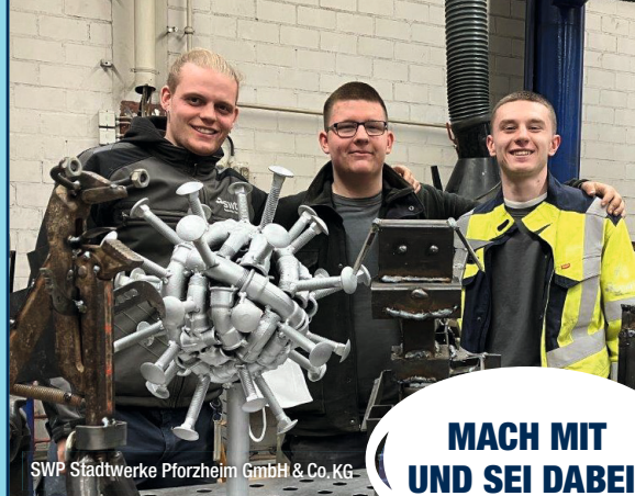
SWP Stadtwerke Pforzheim GmbH & Co. KG

Der Best-Practice-Katalog kann unter www.azubis-volle-power.de heruntergeladen werden.