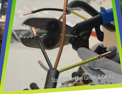
Stadtwerke Ulm GmbH & Co. KG