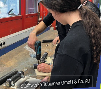
Stadtwerke Tübingen GmbH & Co. KG